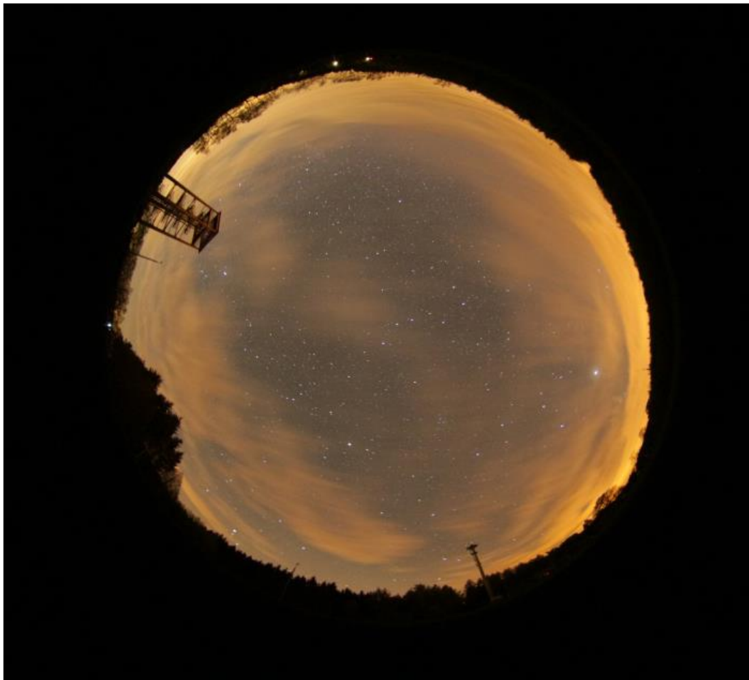
Fischaugenaufnahme des Himmels über dem Beobachtungsplatz (mit Bewölkung)