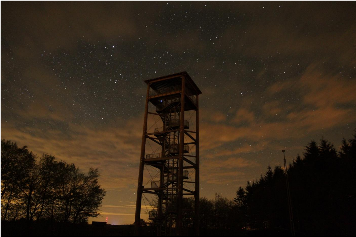
Aussichtsturm bei Nacht