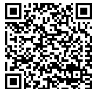
Details im Web